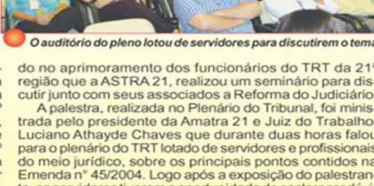
O auditório do pleno lotou de servidores para discutirem o tema

brasileira, que ganhou novas atribuições. No entanto, as mudanças precisam ser entendidas de perto pelos servidores dos Tribunais Regionais do Trabalho, e foi pensando