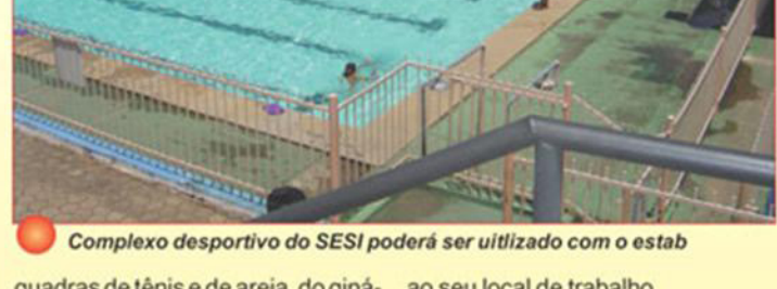
Complexo desportivo do SESI poderá ser utilizado com o estab

Além disso, ainda estarão à disposição do associado, o aluguél das