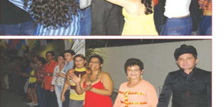
Servidores e familiares se confraternizaram nos festejos

Além dessa festa também está agendada para o dia 28 de junho, na sede da ASTRA em Pium, o São João em parceria com o Sintrajun, onde também haverá muito forró, animação, quadrilha improvisada, fogueira, canjica, pamonha e milho verde.