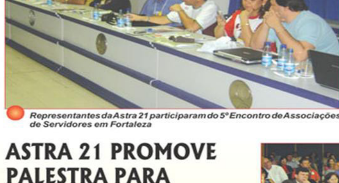
Representantes da Astra 21 participaram do 5º Encontro de Associações de Servidores em Fortaleza

Representantes de Associações de 14 Estados reuniram-se em Fortaleza para discutirem temas relativos à organização das entidades em torno de um calendário anual de atividades